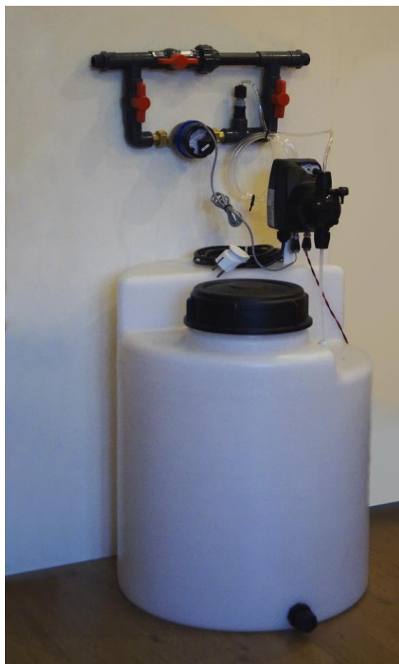
Фото возможного варианта монтажа станции «Дозафон-3» («Дозафон-5»)

Комплектность поставки: — дозирующий электромагнитный/мембранный насос; - импульсный расходомер-счетчик (1 литр/импульс) для измерения расхода воды в подпитке котельной; — датчик уровня раствора реагента в баке; — клапан/инжектор для впрыска раствора в трубопровод; — фильтр-клапан забора раствора из бака; — шланги забора/подачи раствора.