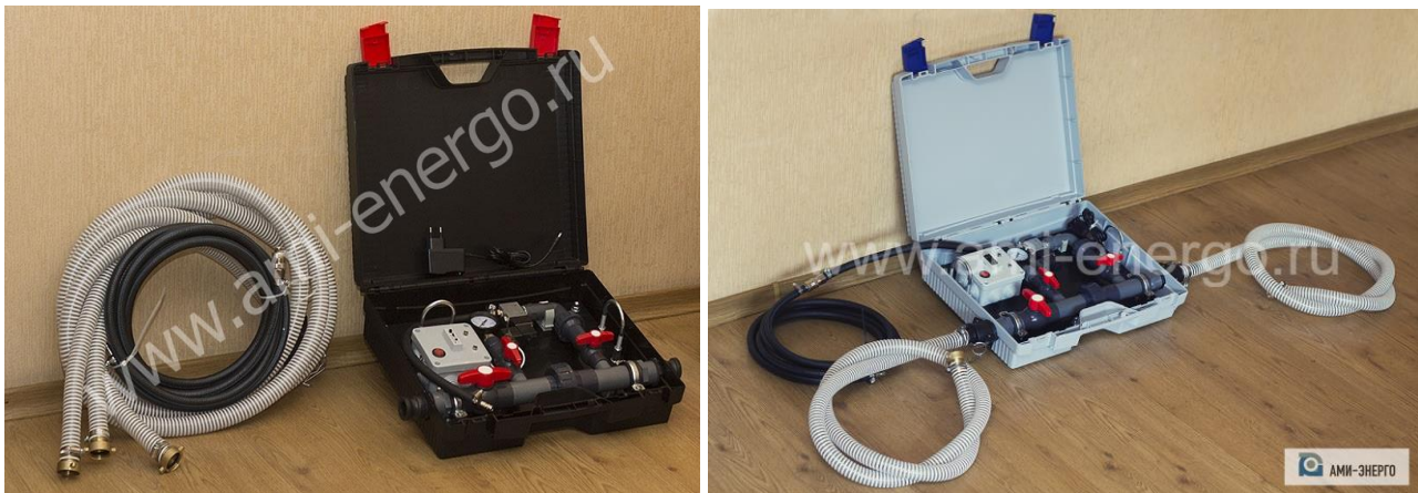
Фото исполнений установки УГП-МИКС (поставка - из наличия на складе изготовителя)

Установка предназначена для работы с широко распространенными типовыми компрессорами с характеристиками: - давление до 8 бар; - емкость ресивера 24 л; - расход сжатого воздуха – до 170-240 л/мин; - напряжение питания – 220 В; - мощность – 1,2-1,5 кВт.